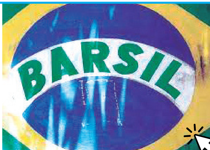
Novo país “Barsil”

O diretor da OMS-Europa, Hans Kluge, considerou esta tendência “preocupante” e defendeu que a única forma de proteger as crianças da doença é através da vacinação.