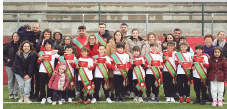
Este é o 2.º título do clube na AF Porto

O Rio Mau Futebol Clube sagrou-se Campeão de Série no escalão de Traquinhas SUB 9 (FUT 5) na liga Carlos Alberto Associação de Futebol do Porto.