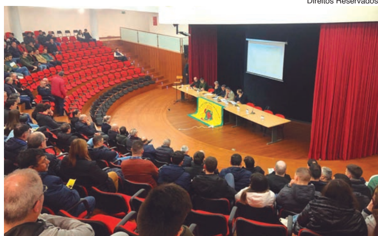
AG decorreu esta terça-feira