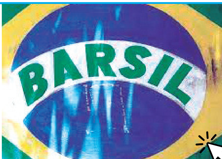
Novo país "Barsil"

Por outro lado, a maioria dos inquiridos afirma ser proprietário de casa própria (69%), enquanto 28% vivem em casa alugada. Estes dados vão ao encontro dos divulgados pelos Censos 2021, que detalha ainda que cerca de 62% das habitações ocupadas pelos próprios proprietários não têm encargos com a aquisição de habitação. Há ainda uma pequena percentagem (4%) que escolheu a opção "outra", sendo que viver em casa de familiares se inclui nesta opção. O Porto é a localização onde há um maior número de inquiridos com casa própria (72%).