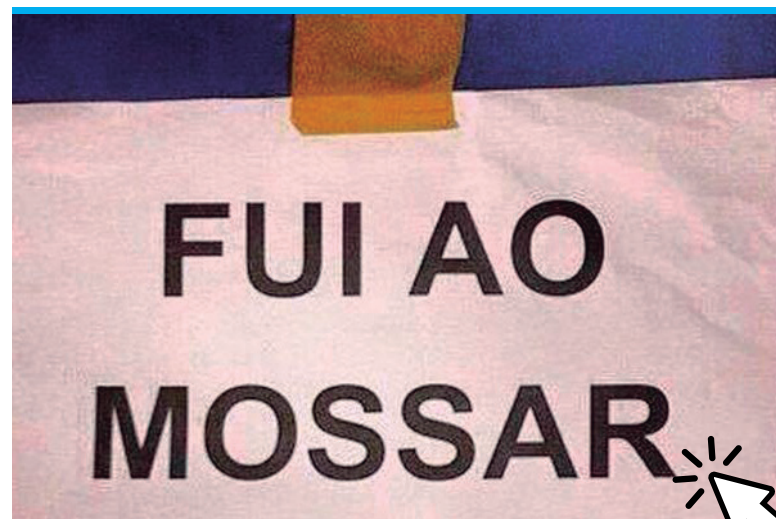
Fui ao mossar

A Igreja Matriz de São Martinho de Penafiel, classificada como Monumento Nacional, de estilo renascentista, começou a ser construída em 1561 e foi concluída em 1570, sobre a primitiva capela do Espírito Santo, remodelada no Século XVI ao gosto Manuelino por João Correia, rico mercador da cidade de Penafiel, para albergar aí o seu túmulo.