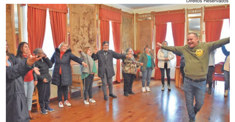
Em Penafiel houve ioga do riso para cuidadores

Em Paços de Ferreira, o grupo de formação que integra as duas