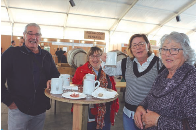
Um animado grupo de Amarante